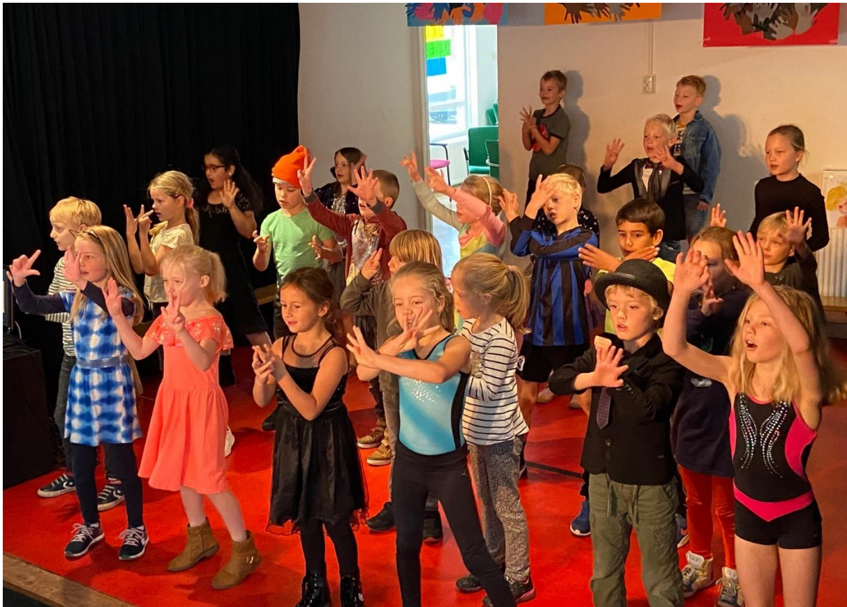
Maandsluiting door groep 4 op vrijdag 25 september 2020

Voor nieuwtjes uit de groepen: kijkt u op onze site www.ivscas.nl